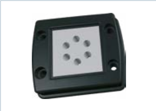
CF4/B1 mit einem Mehrfachdichteinsatz