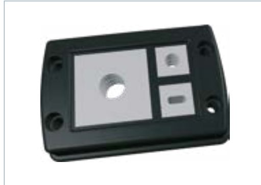
CF6/10 mit T-Gitter und zwei kleinen und einem großen Dichteinsatz