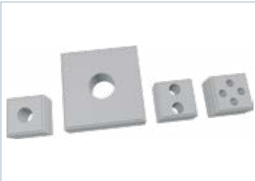
Einfach- und Mehrfachdichteinsätze auch geschlitzt für konfektionierte Kabel