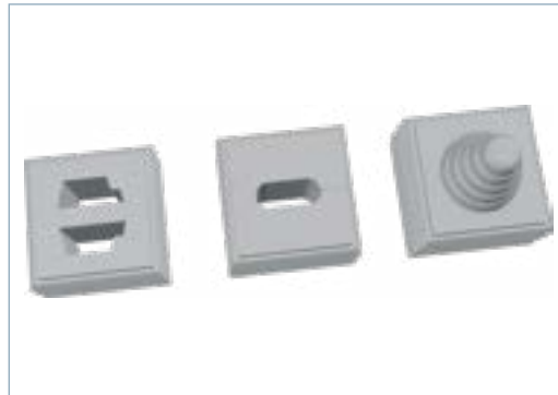
Sonderdichteinsätze und Knickschutzeinsatz