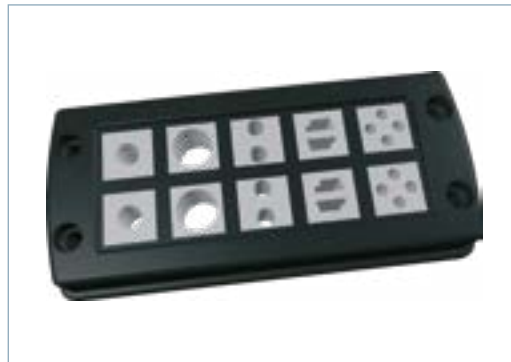
CF10/24 mit Kreuzgitter, Doppelkreuzgitter und Einfachsteg sowie zehn kleine Dichteinsätzen