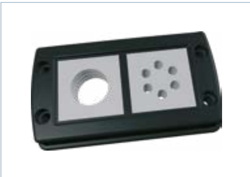
CF8/16 mit Einfachsteg und zwei großen Dichteinsätzen